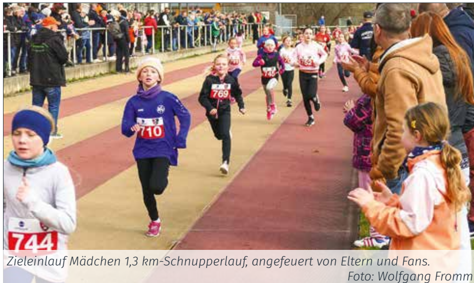
Zieleinlauf Mädchen 1,3 km-Schnupperlauf, angefeuert von Eltern und Fans.

Seit mehr als 20 Jahren bietet die Leichtathletik-Abteilung des SV Lok Blan-