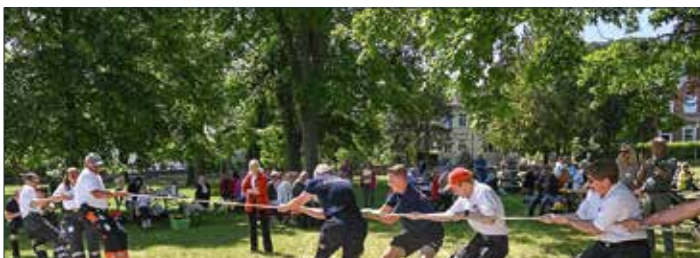
Es wurde sportlich während des Bürger-Picknicks im Jahr 2023, als das DRK gegen die Freiwillige Feuerwehr im Tauziehen antrat.

Melden Sie sich bis zum 19. Mai 2024 unter www.eveeno.com/bpn-blankenburg an. www.stadtpark.blankenburg.de