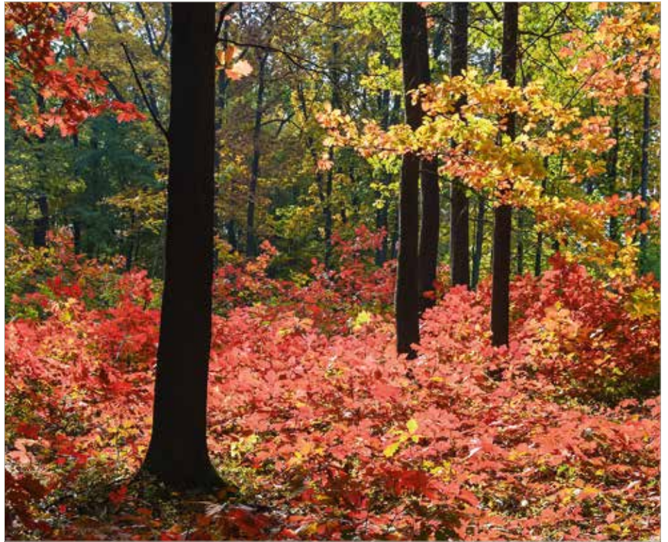
Die dichten Blätterdächer der Roteichen verhindern auf natürliche Weise die Entstehung und Ausbreitung von Waldbränden.

Dieses Wissen ist in den vergangenen, regenreichen Jahrzehnten etwas in den Hintergrund geraten. Aufgrund der aktuellen Entwicklung besinnt man sich heute wieder darauf und legt neue Ro-