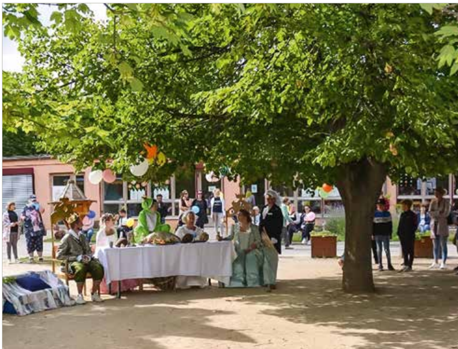
Die Theaterkiste des GVS führte das Märchen vom Froschkönig auf.

Ein buntes Treiben herrschte Anfang Juli als zahlreiche Kinder und ihre Familien sowie allerhand Gäste der Einladung zum Sommerfest der GVS-Kindertagesstätte „Am Regenstein“ folgten.