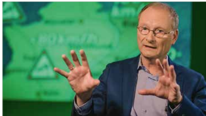
Der bekannte Meteorologe und Moderator Sven Plöger möchte in Blankenburg mit Ihnen über das Klima reden.

Welchen Nutzen hat die Teilnahme? Die SUNK beantwortet diese Frage auf ihrer Website www.sunk-lsa.de zunächst ganz knapp: „Denn wir müssen reden!“ und führt weiter aus, der Klimawandel sei ein globales Problem und eine ernstzunehmende Bedrohung – auch für uns in Deutschland. Die letzten vier Jahre hätten, wenn wir nicht handelten, eine eindruckliche Vorschau auf das Gegebene, was in den nächsten Jahrzehnten auf uns zukomme.