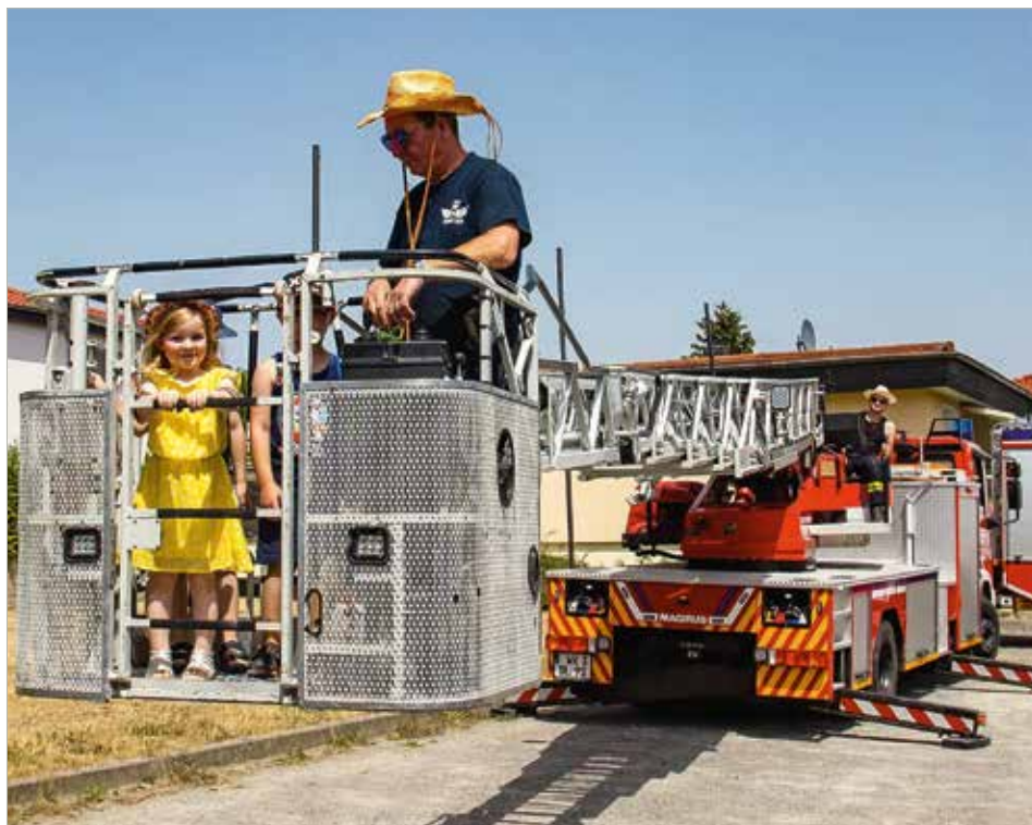
Mit der Drehleiter der Freiwilligen Feuerwehr Blankenburg ging es hoch hinaus.

Ein großer Dank geht an alle Unterstützer des Kinder- und Familienfestes. Es war ein gelungener Nachmittag, der allen Teilnehmenden noch lange in Erinnerung bleiben wird.