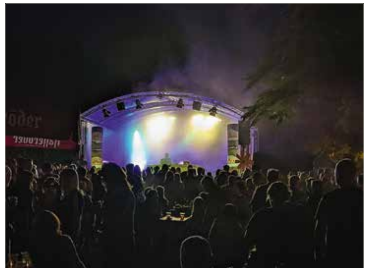
Am Freitag sorgte die 89.0 RTL Clubnight mit heißen Beats für beste Partystimmung.