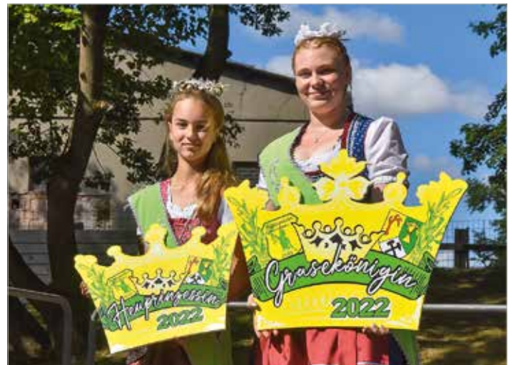
Die diesjährigen Hoheiten.

Der Grasedanz ist urkundlich bis in das Jahr 1887 zurückzufolgeln. Frauen und Mädchen zogen damals mit Sichel und Tragekorb auf die Bergwiesen, um Futter für die Tiere zu holen. Im Spätsommer fiel ihnen die Hauptarbeit des Heumachens zu. Die Männer waren als Hauptverdiener vorrangig im Bergbau und der Forstwirtschaft tätig. Als Entschädigung für die harte Arbeit der Heuernte durch die Frauen entstand das Heuertefest, der Grasedanz.