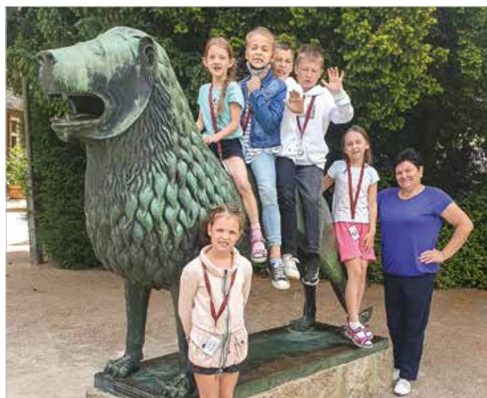
Den Besuch in Blankenburg nutzten die Kinder aus Weißrussland für ein Gruppenfoto an unserem Löwen im Barockgarten.