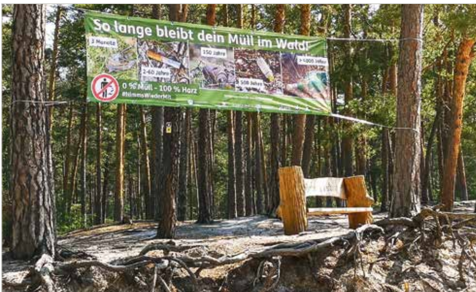
Auch in den Sandhöhlen im Heers ist ein Banner zu finden.

Der Blankenburger Tourismusbetrieb und die Harzer Wandernadel haben gemeinsam eine Aktion gegen die Vermüllung unserer Wälder und der schönen Natur rund um die Blütenstadt Blanken-