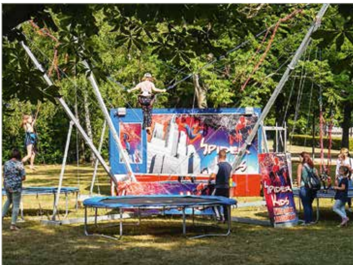
Das Trampolin war eines der Highlights für die kleinen Gäste.

Für die Organisatoren ist die Premiere des Blankenburger Blütenfestes mehr als gelungen. „Wir sagen allen Unterstützern, Sponsoren, Mitwirkenden und Besuchern danke schön“, verkündete Bürgermeister Heiko Breithaupt. „Ihr alle habt das Blütenfest zu einer schönen Veranstaltung gemacht. Neben Spaß und Musik geht es bei solch einem Fest auch immer um das Miteinander und das Für-einander. Ich freue mich jetzt schon auf das Blütenfest 2023.“