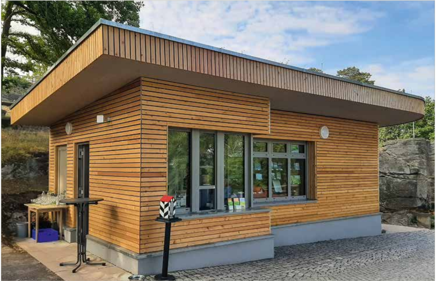
Das moderne Servicegebäude empfängt ab sofort alle Besucher der Burg und Festung Regenstein

Auf der Burg und Festung Regenstein wurde am 9. August der neue Servicepunkt für Rad- und Wandertouristen offiziell eingeweiht. Neben den modernen, barrierefreien WC-Anlagen und den noch zu installierenden Schließfächern für Wandergepäck oder Fahrradhelme wurde der Kassenbereich an bewährter Stelle in das Gebäude integriert. Besucher können hier Souvenirs oder Literatur über die historische Anlage erwerben. Das Dach wurde begrünt, damit es sich trotz moderner Holzoptik auf natürliche Weise in die Anlage einfügt. Auch eine neue Schrankenanlage wurde errichtet. Diese ist vom Kassenhaus aus bedienbar. Gleichzeitig erfolgte der symbolische Start für das WLAN-Netz, das ab sofort allen Besuchern kostenfrei zur Verfügung steht. Somit ist die im Vorjahr installierten dreidimensionalen Augmented Reality-Installationen (AR) der früheren Gebäude auf der Festungsanlage noch besser nutzbar. Die AR-Visualisierung sowie das freie WLAN wurden vom Ministerium für Digitales und Infrastruktur des Landes Sachsen-Anhalt gefördert. Installiert wurde dieses von der Wernigeröder Firma Heuer & Sack, die bereits das Biologische Freibad „Am Thie“ sowie das Freibad Derenburg mit freiem WLAN ausgestattet hat.