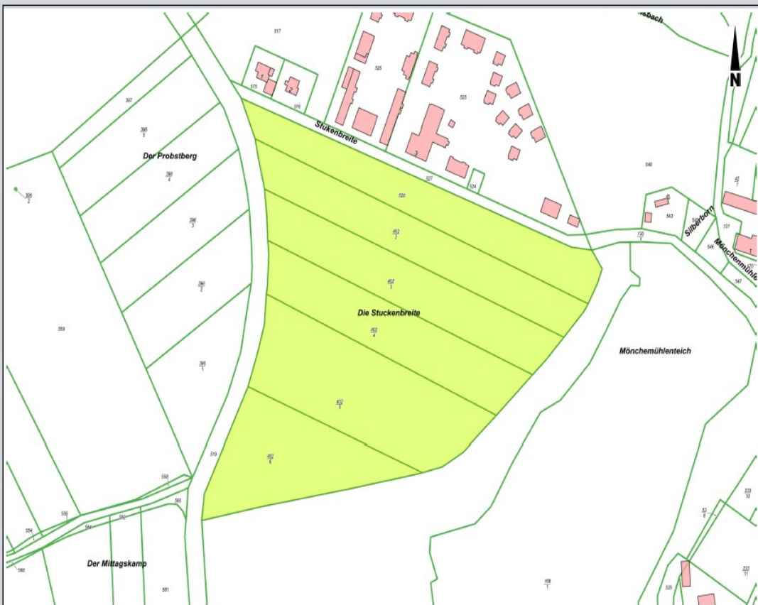
Übersichtsplan mit dem Geltungsbereich des Bebauungsplanes Nr. 19/ 21 „Stukenbreite“, Blankenburg (Harz)“