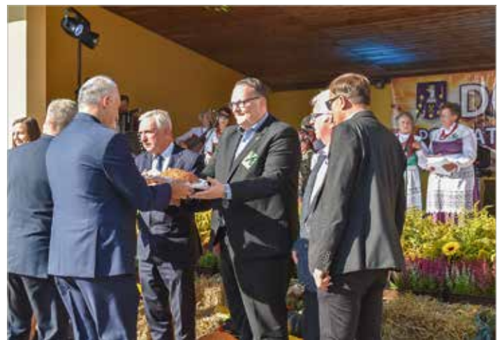
Traditionell teilen Landwirte und Gäste gemeinsam das Brot, das aus dem Getreide der diesjährigen Ernte gebacken wurde.

Die freundschaftlichen Beziehungen zwischen dem Landkreis Ostrzeszów und der Stadt Blankenburg (Harz) bestehen schon seit den 1970er Jahren, am 4. September 2010 wurde dies in einem Partnerschaftsvertrag offiziell besiegelt.