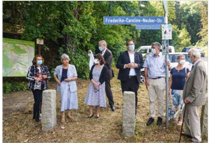
Der Weg vom Schieferberg hoch zum Großen Schloss führt künftig über die Friederike-Caroline-Neuberin-Straße.