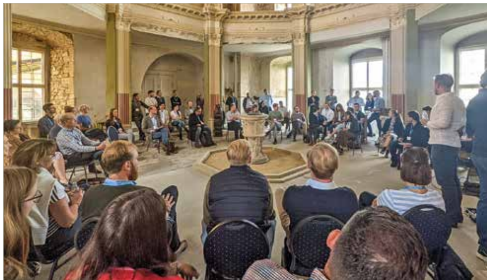
Das Große Schloss bot einen einzigartigen Rahmen für das erste Future Forest Forum.