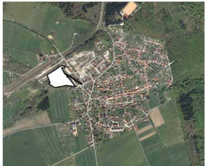
Ortslageplan mit dem Geltungsbereich der Satzung des vorhabenbezogenen Bebauungsplanes Nr. vbB 01/16 "Photovoltaikanlage OT Hüttenrode, Blankenburg (Harz)" Gemarkung Hüttenrode Flur 4 unmaßstäblich