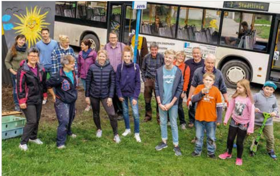
Beim Kehrtag 2018 wurde das Bushäuschen in der Karl-Zerbst-Straße mit einer Malaktion neu gestaltet.