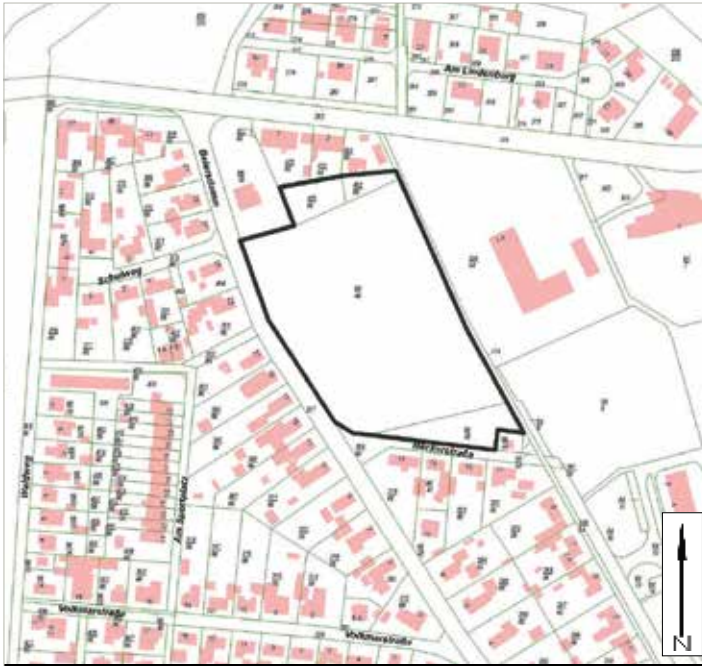
Übersichtsplan mit dem Geltungsbereich des Bebauungsplanes Nr. B 17/19 „Wohnbebauung „Am Beiersdamm“, Blankenburg (Harz)“ Gemarkung Blankenburg Flur 44 unmaßstäblich