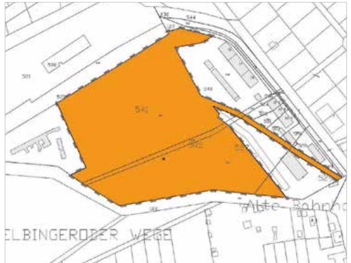
Flurkartenauszug mit dem Geltungsbereich der Satzung des vorhabenbezogenen Bebauungsplanes Nr. vbB 01/16 "Photovoltaikanlage OT Hüttenrode, Blankenburg (Harz)" Gemarkung Hüttenrode Flur 4 unmaßstäblich