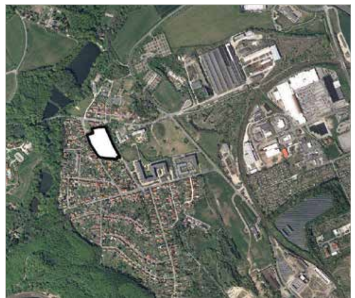
Übersichtsplan mit dem Geltungsbereich des Bebauungsplanes Nr. B 17/19 „Wohnbebauung „Am Beiersdamm“, Blankenburg (Harz)“ Gemarkung Blankenburg Flur 44 ↑ N

gez. Heiko Breithaupt Bürgermeister der Stadt Blankenburg (Harz)