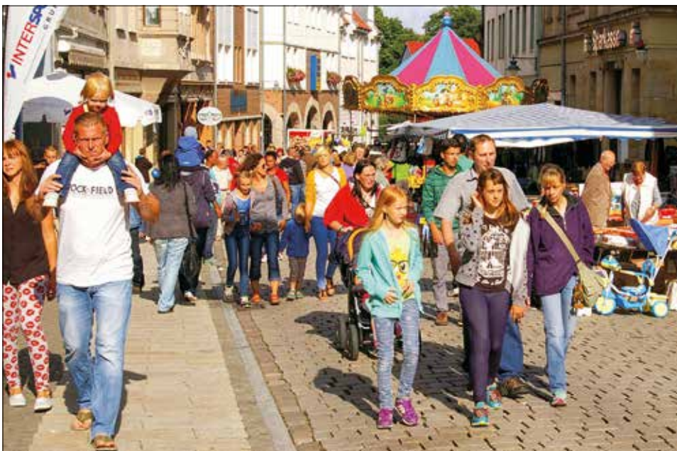
Reges Treiben herrscht während des Altstadtfestes im Blankenburger Zentrum, hier ein Blick in die Lange Straße.