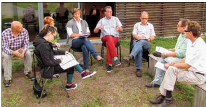
Lebhaftige Diskussion in der Arbeitsgruppe Marketing/Wirtschaftsförderung im Kloster Michaelstein.

Zu einem nächsten Treffen mit Grillabend lädt die Interessengruppe für Montag, 6. Oktober, ab 19 Uhr auf das Grundstück der Freiwilligen Feuerwehr an der Neuen Halberstädter Straße ein. Interessenten werden gebeten sich bis zum 30. September unter berge13@web.de mit Angabe der Personenzahl anzumelden. Es wird ein Kostenbeitrag von 5 € pro Person erhoben.