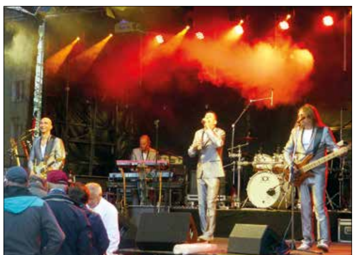
Die Gruppe „Tänzchentee“ sorgt für gute Laune und Partystimmung bis spät in den Abend.