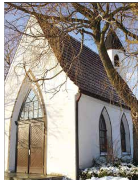
Die Friedhofskapelle in Timmenrode.

Die unlängst renovierte Friedhofskapelle kann besichtigt werden.