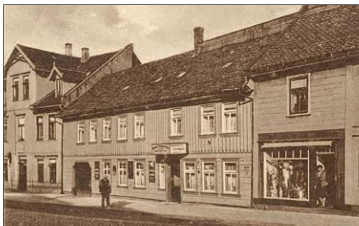
Der „Schwarze Bär“ wie ihn die älteren Blankenburger kennen, hier noch mit dem Textilgeschäft Bindernagel rechts daneben.