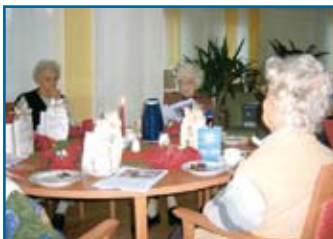
In der Gemeinschaft: Nicht mehr allein zu Hause

Im Eingangsbereich finden Sie eine Kaffeebar, offene Rezeption und Wasserspiele. Die Außenanlagen laden zum Verweilen ein. Es gibt ein Hochbeet, Gartenteiche, einen Grillplatz und viele Sitzgelegenheiten.