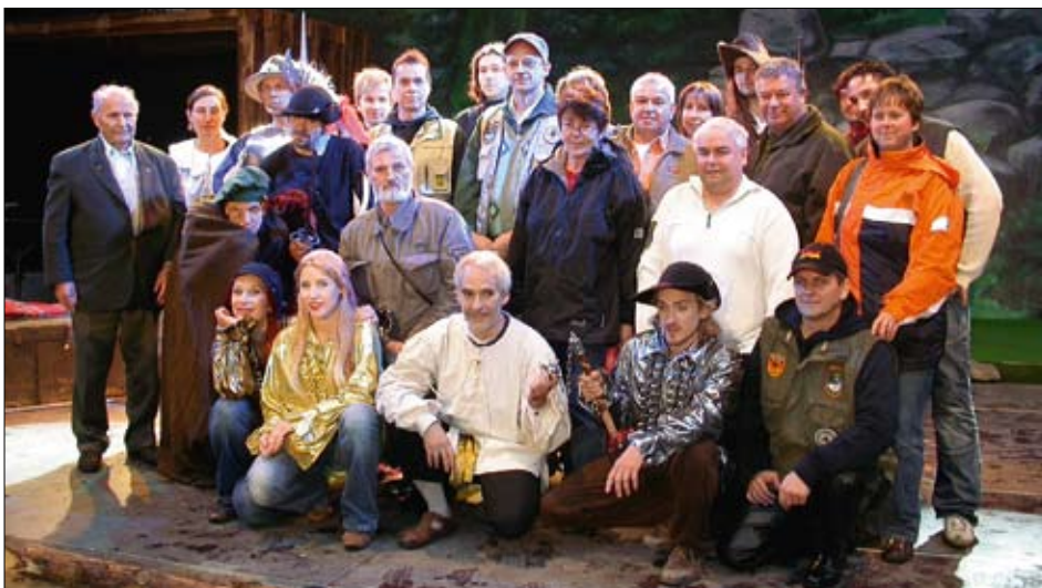
Gemeinsam mit den Akteuren des Rock-Musicals posierten die Wienröder „Harzschützen“ nach der Aufführung auf der Freilichtbühne im Harzgeröder Schloss.

Nach dem großen Erfolg der Rockoper „Faust“ auf dem Brocken, zu deren 40. Aufführung am 1. November der 10 000ste Besucher erwartet wurde, entstand bei der HSB die Idee, ein weiteres Unterhaltungserlebnis für die Harztouristen anzubieten. „Vorbild sollten u. a. die Störtebecker-Festspiele an der Ostsee sein“, erklärte Vertriebsleiter Dr. König. In dem Roman von Otto Gotsche habe man eine geeignete Vorlage gefunden. In alten Kirchenbüchern seien zudem authentische Namen aus der Zeit des 30-jährigen Krieges gefunden worden. Nachdem auch die passende Musik komponiert wurde, konnte das Stück im Harzgeröder Schloss aufgeführt werden. 2009 soll es hier weitergehen. Nähere Informationen gibt es u. a. im Internet unter hsb-wr.de - events Rockmusical