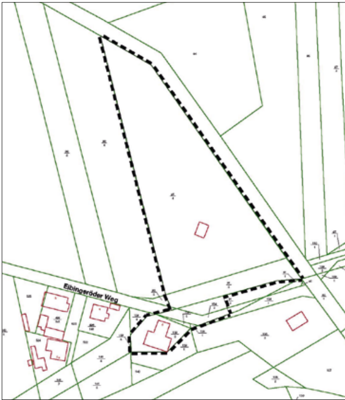
Auszug aus dem Übersichtsplan Hüttenrode mit dem Geltungsbereich des vorhabensbezogenen Bebauungsplanes „Metallbaubetrieb Abel“, Hüttenrode Unmaßstäblich.