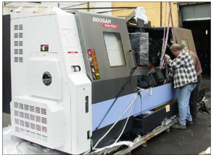
Die erste der beiden hochmodernen CNC-Maschinen wurde bereits geliefert. Ein zweites „Drehzentrum“ für die Zylinderlaufbuchsen-Bearbeitung in den Harzer Werken wird im Dezember folgen.