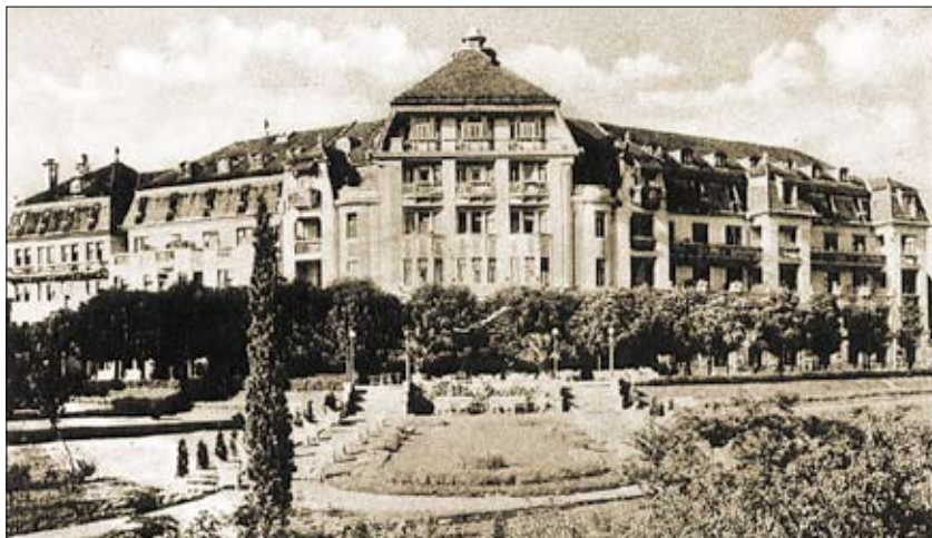
So sollte das Kurmittelhaus im Thiepark (Blick vom heutigen Springbrunnen in Richtung Gymnasium) in der Planung einmal aussehen.