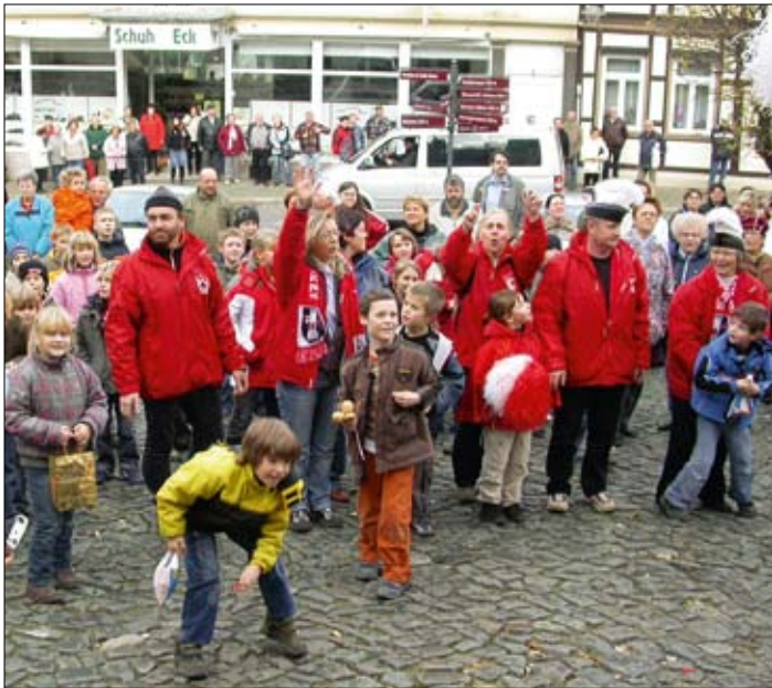
Viele Blankenburger verfolgten zusammen mit dem Karnevalverein die fröhliche Eröffnung der „fünften Jahreszeit“.