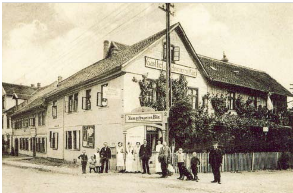
Der „Schwarze Bär“ war einst das erste Wirtshaus vor den Toren der Stadt Blankenburg (Harz) und bot Kost und Quartier für zahlreiche Durchreisende