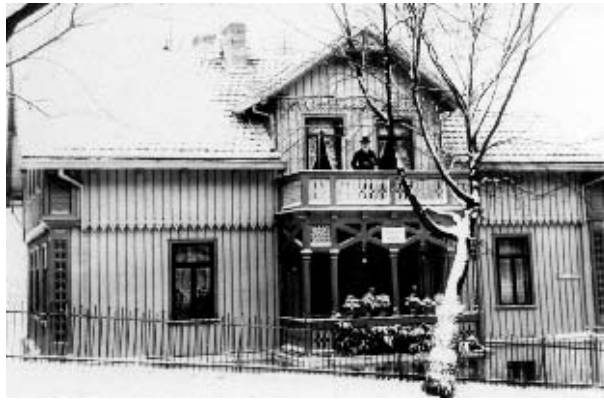
Die Pension Rabe in einer historischen Aufnahme.