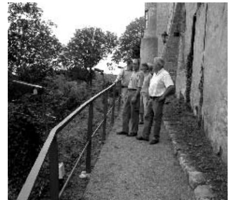
Mitarbeiter des Schlossvereins bei der Übergabe des Rundweges.