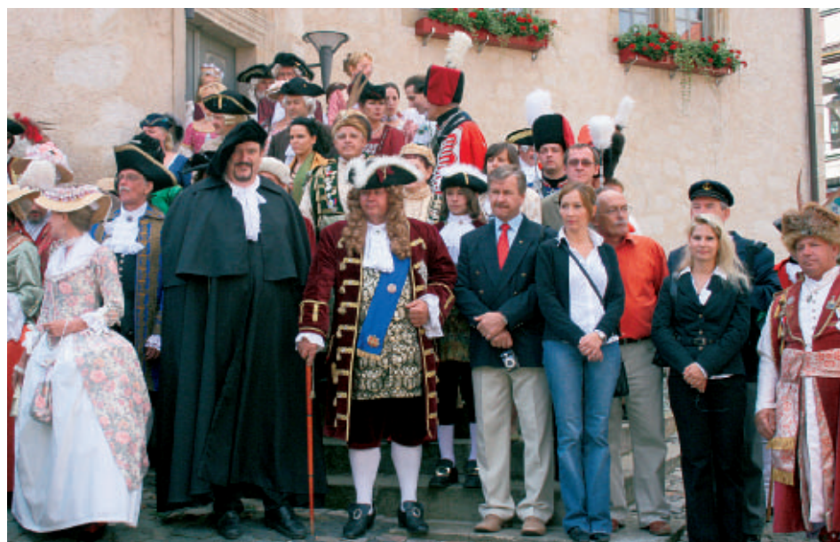
Auf den Stufen vor dem Rathaus posierten die Akteure noch einmal für die Fotografen, bevor sie durch die Straßen der Altstadt weiterzogen.