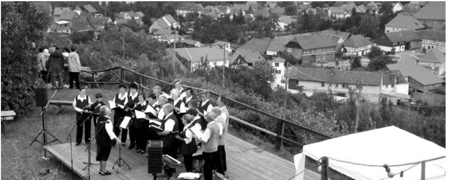
Vom Burgberg kann man einen wunderschönen Blick über Heimburg und in der Gegenrichtung über das Harzvorland genießen.

Einen besonderen Dank richten Vorstand und Mitglieder des Vereins an den Heimburger Gemeinderat, der den Kauf des Burgbergs ermöglicht hat, so dass dort weiterhin das Burgfest gefeiert werden kann.