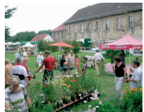
Das Klosterfest am Sonntag zählte doppelt so viele Besucher wie im vorigen Jahr.