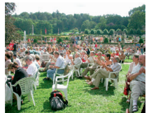
Bei herrlichem Sommerwetter genossen die Besucher das dreitägige Fest.