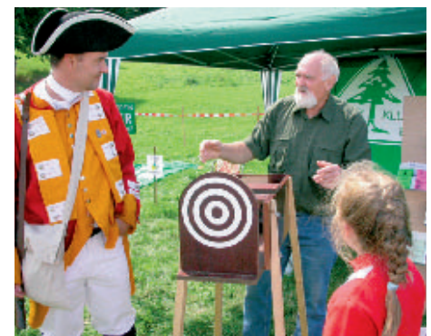
Der Harzklub-Zweigverein bot für die großen und kleinen Gäste Infos sowie Spiel und Spaß.