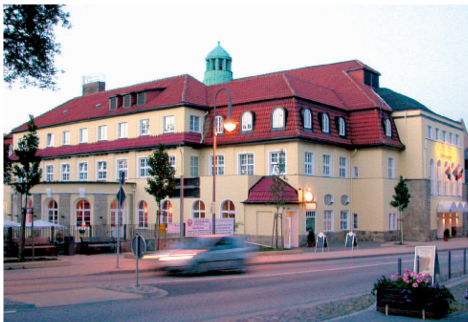
Das „Kur- und Wellnesshotel Fürstenhof“ erstrahlt auch von außen in völlig neuem Glanz. Im Restaurant „Vis-a-Vis“ soll es wieder regelmäßige Veranstaltungen für die Blankenburger geben.